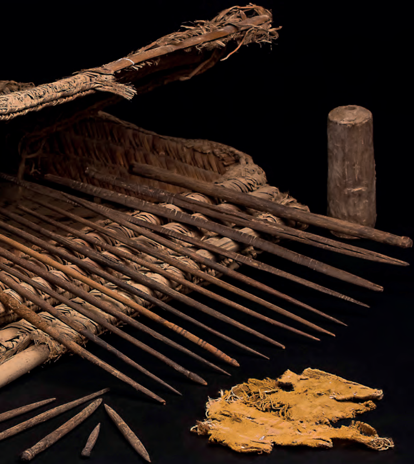
Costurero con instrumentos para textilería.